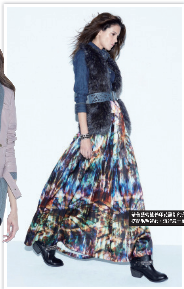
帶著藝術塗鴉印花設計的長裙， 搭配毛毛背心，流行感十足。