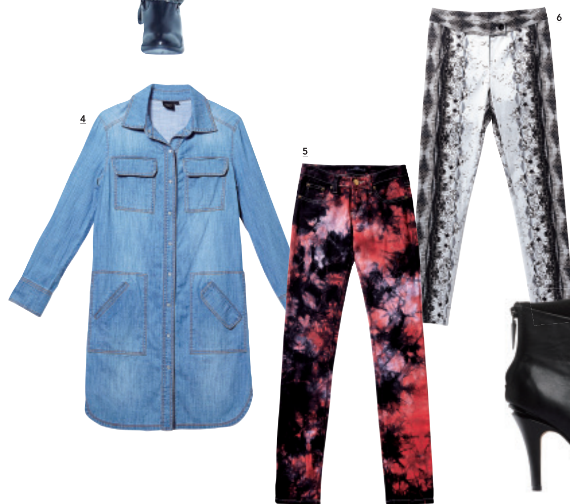
1 黑色毛毛開襟背心 2 紅色米字旗長版背心上衣 3 黑紅色拼 接風方包 4 藍色丹寧襯衫式長上衣/洋裝 5 黑紅色印花緊身 褲 6 灰色印花緊身褲 7 黑色高跟短靴 8 駝色拼接風手拿包

打開衣櫃看一下自己的衣服，是不是發現有好多 件款式類似、顏色相近的衣服？或是穿來穿去造 型總是相差無幾？這就表示妳可能擁有了太多基 本款式的衣服了。雖然每位時尚達人都會教導基 本款式的衣服一定要多準備一些，但這只會讓妳 在裝扮上不出錯，想要更出色，就要靠每季掌握 當季的流行風向，並適時添購一些流行單品，才 能增加時尚度，衣著亮眼出色了，人會更有精神 及自信，發於內形於外，絕對讓妳有人氣。自 2012年延燒的英倫風這一季仍是處處可見，相信 在今年英國凱特王妃誕下新生兒時會衝向高峰， 不妨在衣著上也加入一些英倫元素，以英國米字 旗變化為圖騰的上衣、帶著英國龐克風的不對稱 衣著、很有倫敦街頭風的印花長裙搭牛仔襯衫， 都非常的時尚好看；當然緊身褲也是另一個流行 重點，而且今年多以印花為主，只要選擇合適的 色系及圖騰，也能有修飾腿型的效果。