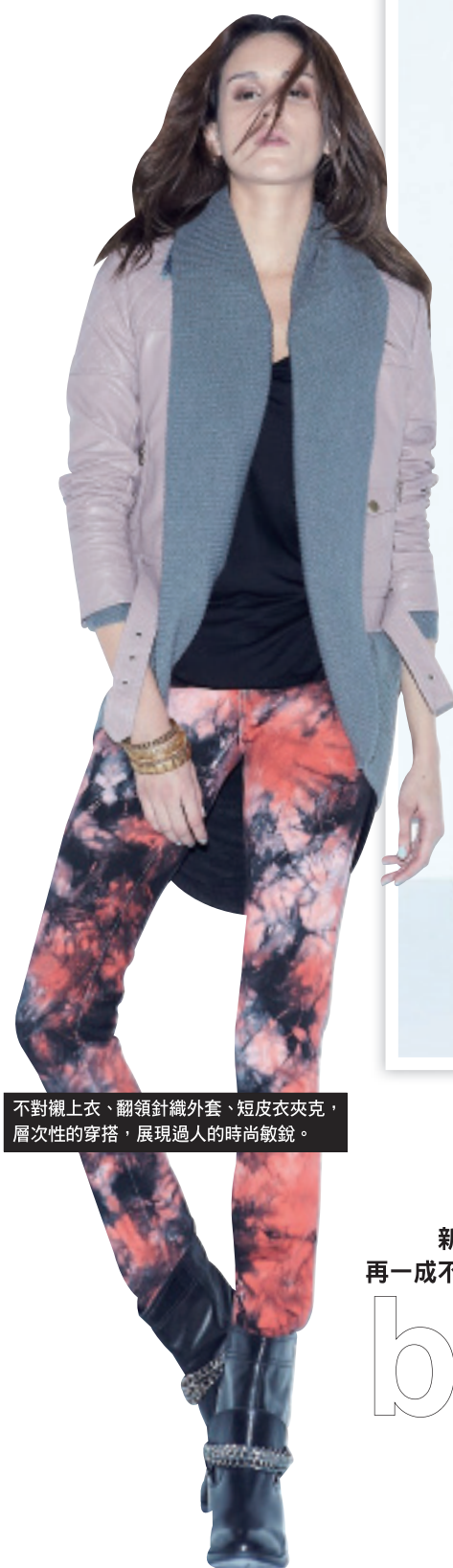
不對襯上衣、翻領針織外套、短皮夾克， 層次性的穿搭，展現過人的時尚敏銳。