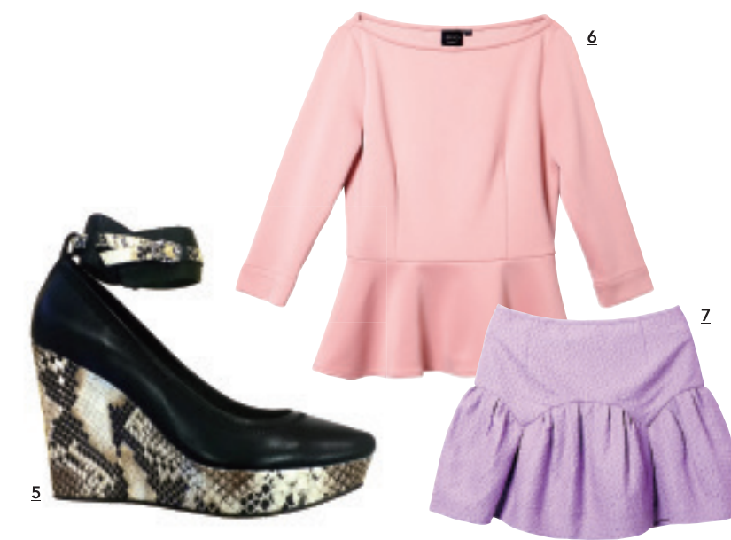
1 黃色腰部打褶洋裝 2 粉紅色水波紋夾克 3 膚粉色公主小泡袖針織上衣 4 駝色毛線領圍 5 蛇皮壓紋船型鞋 6 粉紅色拼接圓弧下擺上衣 7 粉紫色短圍裙

過年期間總要出門去走春，不論是見見家中長輩、拜訪男友家人，都希望給人 留下好印象，或者是單身的女孩，也想要這新的一年有新戀情，多多出門和朋友 去走走就對啦！以甜美的造型為主調來裝扮自己，絕對是出錯又能帶來好 印象的打扮。甜美可以分成二個主要層面來說，一個是在色系上，以粉色系為 主調來做搭配，淡粉紅色可以增添光彩、膚粉紅色看起來氣質佳、粉黃色則顯溫 柔、而粉藍色又增加一分清新，隨着自己的膚色及個性來選搭；另一個帶來甜 美質感的層面在於整體的線條，例如有澎度的裙子或短褲、公主小泡袖、腰部的 細褶等，都能讓衣著有曲線變化，整體上更為亮眼；而洋裝或裙子長度如果 是及膝，多了一分端莊，如果是短一點，則會更顯活潑俏麗。在這些顏色些微 的差異與線條長度的變化中，不妨多試試看，就能穿出自己的甜美風格。