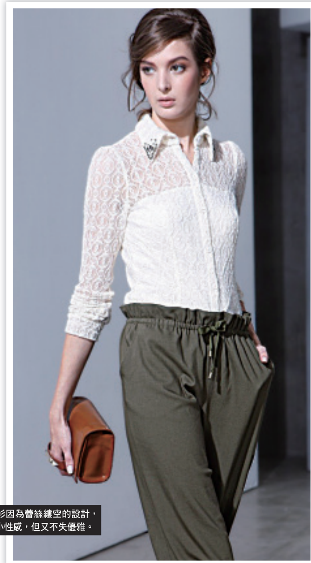
平凡的襯衫因為蕾絲鏤空的设计，帶着一點小性感，但又不失優雅。

很多人都有職場上懷才不遇的感覺，當然職場上的專業能力、領導能力、待人接物都會有影響，但是也不要忽略了職場造型給人的印象；例如穿著隨便出席客戶的正式簡報會議，或是只是中午的餐會就盛裝打扮，又或是在辦公室衣著過於曝露等，都會令人留下不好的印象或是在專業度上就先讓人打了折扣，所以職場衣著也是自我投資的一環，絕對不能省。當然工作種類不同會各有不同合適的裝扮，以一般上班族來說，一件有造型的襯衫是必備基本款，可以單穿或是搭配毛衣、外套等，做出很多變化；還有就是剪裁版型佳的合身短外套，也是百搭必備款，容易就能搭出俐落感；而簡單的無袖洋裝，在白天時搭配外套端莊有型，晚上臨時有活動時，只要脫下外套換上誇張一點的配件，也能隆重不失禮；另外粉領族的心頭好—窄裙，今年的版型除了腰線提高外，腰部常見的是層疊荷葉邊，十分好看，當然基本款的及膝裙也是不可少的單品之一。