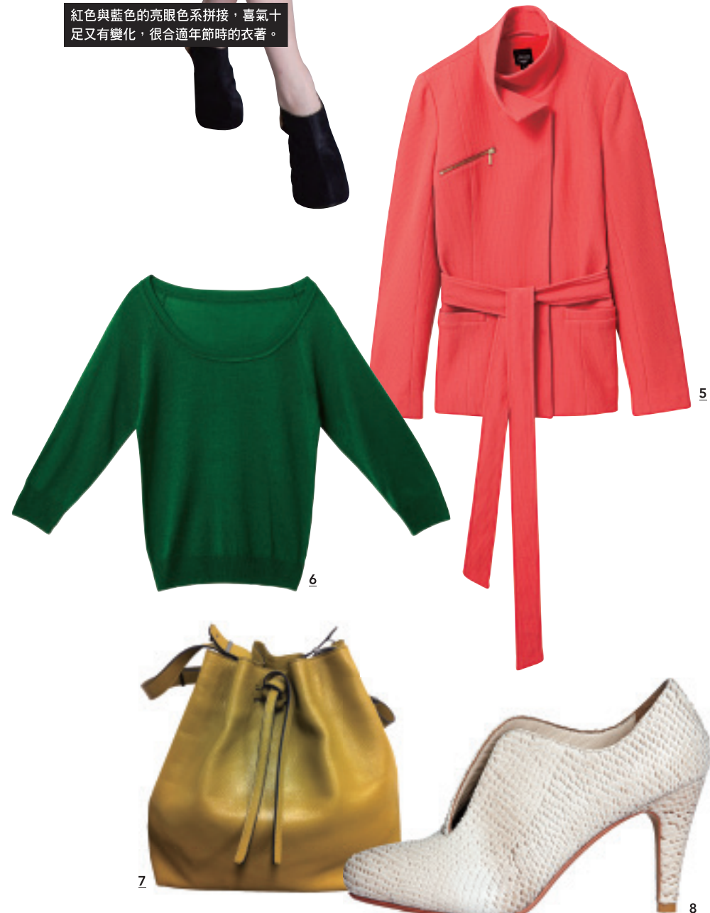
紅色與藍色的亮眼色系拼接，喜氣十足又有變化，很合適年節時的衣著。